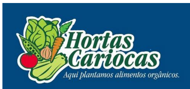
Figura 2: Logotipo do Projeto Hortas Cariocas

No Rio de Janeiro, foi criado na Secretaria Municipal de Meio Ambiente (SMAC), pela Gerência de Agroecologia e Produção Orgânica, o Projeto Hortas Cariocas que visa incentivar a criação de hortas comunitárias 2 em áreas carentes no município que propiciem postos de trabalho, capacitação e a oferta de gêneros alimentícios de qualidade e a custos acessíveis.