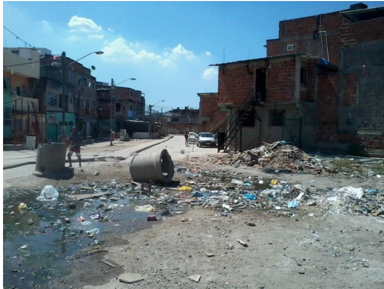
Figura 11: Local onde havia um parquinho para as crianças e o 'barracão' para armazenamento de ferramentas do PHC. Destruído pela CEDAE para obras que não aconteceram, resultando em uma área de depósito de lixo e esgoto a céu aberto.