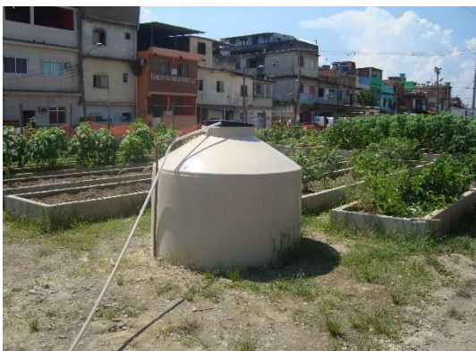
Figura 6: Caixa d'água da horta.

A construção da horta se iniciou em 2013, e teve um orçamento em torno de R$ 500.000,00, com parte da verba advinda do PAC Manguinhos. Foram retirados 700 caminhões de entulho de obra e lixo que se encontravam no local, além da camada superficial do terreno. Houve a remoção de 55 cm de profundidade de terra contaminada e o vale então foi preenchido com 15 cm de brita e pó de pedra e depois com 40 cm de saibro estéreis, além da colocação de bica corrida para evitar mato e lama. Também foram construídas caixas d'água para possibilitar a rega diárias das plantas, além de estufas e viveiros feitos pelos próprios hortelãos.