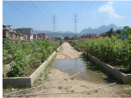
Figura 5: Horta de Manguinhos embaixo das linhas de alta tensão da Light.