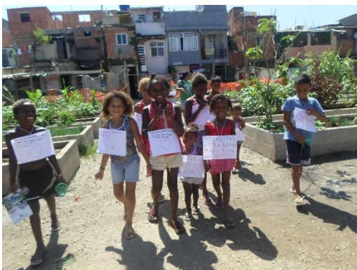
Figura 12: Atividade de educação ambiental

O PHC possui uma parceria com o Centro de Educação Ambiental da SMAC, onde os Agentes Ambientais, profissionais contratados para implementar os projetos de educação ambiental e que agem diretamente na comunidade, realizam oficinas, jogos e visitas com as crianças da região. Além de incentivar uma maior aproximação das crianças com o meio ambiente, promovendo uma conscientização ambiental, ajudam na conservação da horta ao incentivarem as crianças a cuidarem das plantas ao invés de destruí-las