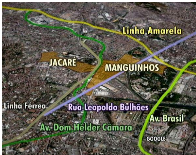
Figura 2: Localização geográfica e vias próximas de Manguinhos.

Manguinhos é parte do mosaico de desigualdades sociais que expressa a cidade do Rio de Janeiro: dos 126 bairros da cidade, Manguinhos está entre as cinco piores situações de qualidade de vida mensuradas pelo IDH junto com Guaratiba, Rocinha, Jacarezinho, Complexo da Maré e Complexo do Alemão, ocupando o 122º lugar.