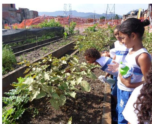
Figura 16: Interação das crianças com as plantas.