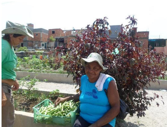
Figura 10: Colheita de quiabo.