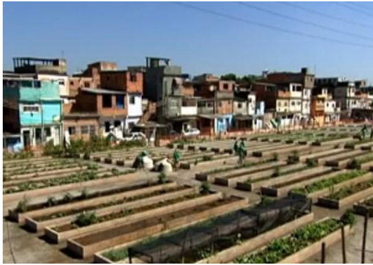
Figura 4: Unidade de Produção de Manguinhos.