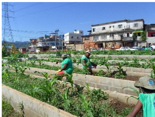
Figura 8: Hortelãs trabalhando na horta.