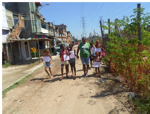
Figura 13: Agente ambiental com as crianças.