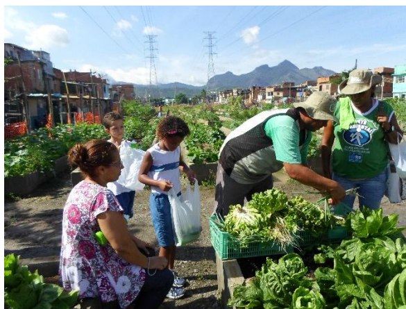
Figura 17: Distribuição de hortaliças colhidas na horta para as crianças.