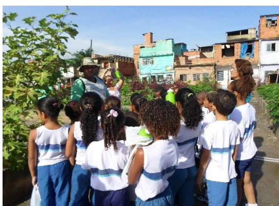
Figura 15: Visita à horta dos alunos do Colégio Municipal.

Educação ambiental : a horta proporciona um espaço para uma maior interação de crianças e adultos com as dinâmicas da natureza, promovendo uma relação de cuidado com o ambiente e com as plantas. Para moradores que nunca tiveram a oportunidade de plantar uma muda, colher uma abóbora, vislumbrar um pé de tomate ou segurar uma joaninha, estas simples interações levam a uma profunda mudança na percepção em relação ao meio ambiente e à produção de alimentos.