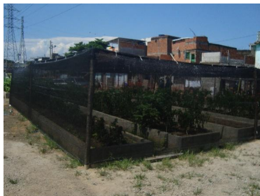
Figura 7: Estufa e viveiro de mudas.