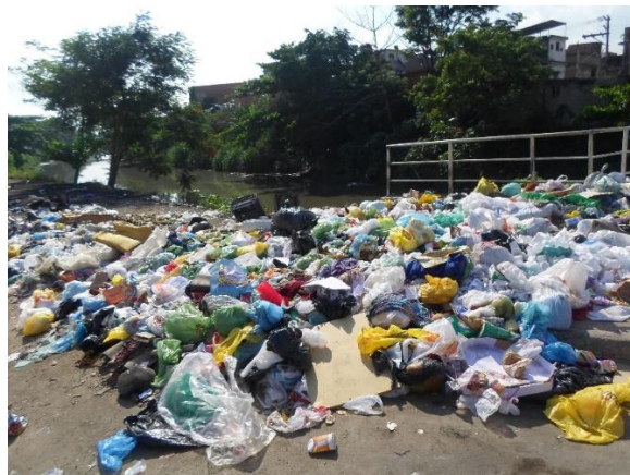
Figura 3: Acúmulo de lixo na beira do Rio Faria Timbó.

Além disso, por se tratar de um manguezal, área naturalmente alagada, as obras de aterramento junto à construção de habitações no local propiciaram um cenário de contínuas enchentes. Devido à falta de um planejamento urbano da região e à escassez de obras e políticas públicas para amenizar o problema, como obras de drenagem de água e esgoto e falta de coleta de lixo, as comunidades sofrem as consequências ao terem suas residências inundadas e ao entrarem em contato com água contaminada, levando ao surgimento de vetores e transmitindo doenças.